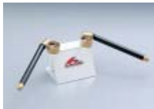
HS4301G ¥12,600(¥12,000) FZR400RR('90~'96 3TJ)