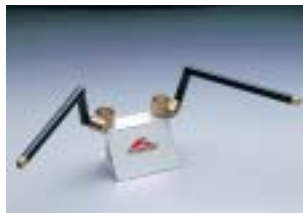
HS4118G ¥12,600(¥12,000) FZ400('97~4YR)