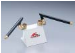
HS3007G ¥12,600(¥12,000) TZR50/R TZM50R