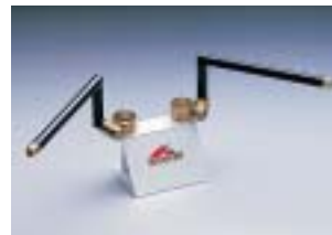
HS4304G ¥12,600(¥12,000) V-MAX1200('93~)