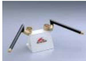
HS3802G ¥12,600(¥12,000) ジール R1-Z SRX400('90~3VN) SRX600('90~3SX)