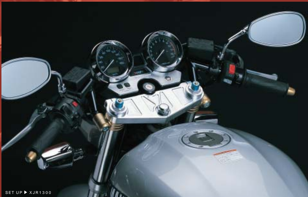
SET UP ▶ XJR1300