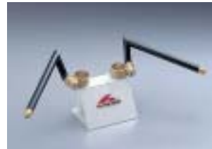
HS4114G ¥12,600(¥12,000) XJR400/S/R カウル付は不可