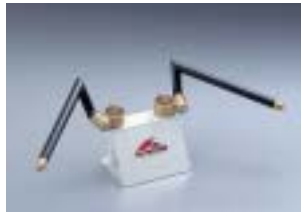
HS3514G ¥12,600(¥12,000) SR400/500 クロームメッキバージョンはP101参照