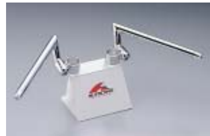
クロームメッキ (P101に掲載の車種のみ)