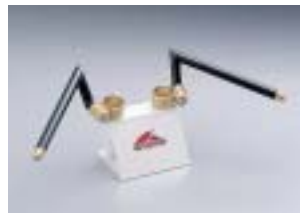
HS4303G ¥12,600(¥12,000) XJR1300 XJR1200 カウル付は不可