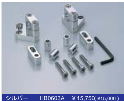
シルバー HB0603A ¥15,750(¥15,000)