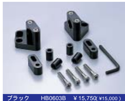
ブラック HB0603B ¥15,750(¥15,000)

ZZR250/400/1100 ZX10 ZX11 GPZ400S GPZ400R/600R/750R/900R GPZ1000RX GPZ1100 (95-水冷) GPX250R/400R/750R FX400R ソケットボルト M8×L45