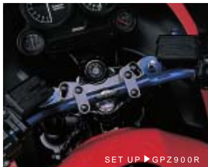
SET UP ▶ GPZ900R

&lt; M8ソケットボルトはステンレス製 / ソケットボルトCAP付 &gt;