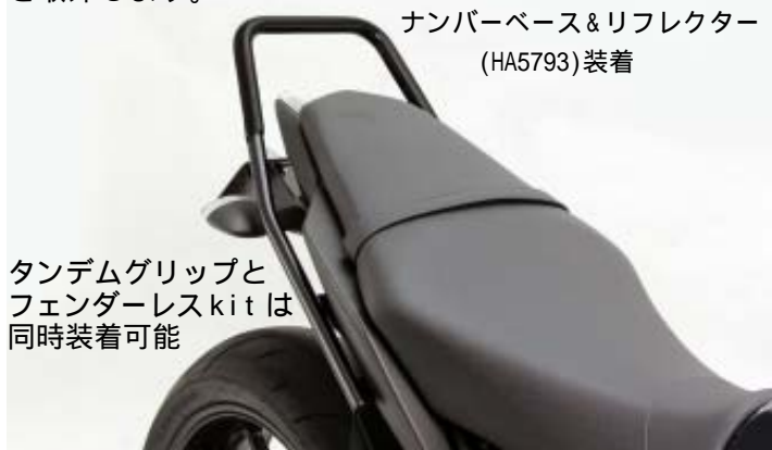
ナンバーベース&リフレクター (HA5793)装着