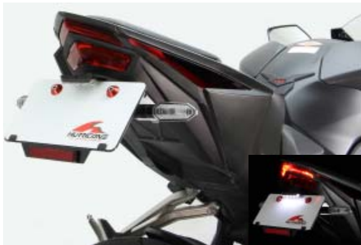
ナンバーベース&リフレクター(HA5793)装着