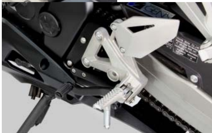
チェンジペダルの固定を別部品にすることでペダルが奥にならないノーマルと変わらない位置に取付出来ます。