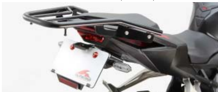
リアキャリアと フェンダーレスkitは 同時装着可能