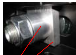
チェーンブラー アクスルカラー

ベースプレートは軽量化と耐久性を考慮した アルミ製ブラックアルマイト仕上。 明るい高輝度白色LEDライセンスランプ、 簡単に接続できる 専用ハーネス付き。 マッドガードを取外した後 アクスルシャフトに入る チェーンブラーと アクスルカラーはアルミ製 シルバーアルマイト。 ノーマルウインカー使用可。