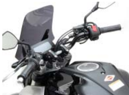
スペーサーリング