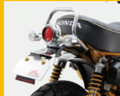
フェンダーレスkit アルミ製ベース / LEDライセンスランプ 簡単に接続できる専用ハーネス付 HA6659 ¥7,000