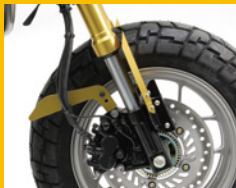
フォークガード アルミ製2ピース カラーは4色の予定 HA6554G ¥5,000(予備)