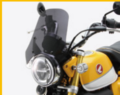
スクリーン アクリル製3mm厚 ブラックスモーク 専用アルミステー付 HA6101 ¥17,000