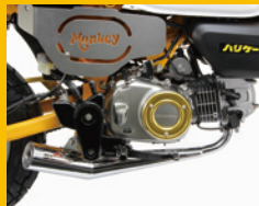
サイドカバー/エンジンカバー & ショートタイプダウンマフラー <試作品>