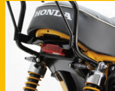
テールランプkit LEDレクタングル クリアレンズも有り ※右記マッドガードとウインカーの交換が必要 HA5820R ¥8,600(予備)