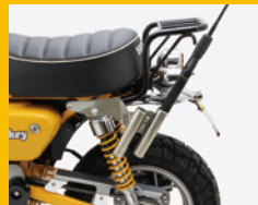
ロッドホルダー ステンレスホルダー全長150mm 内径30mm 専用ステンレス取付ステー付 HU1007S ¥8,600