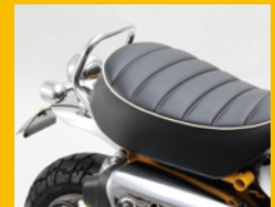
アシストグリップ スチール製 φ19.1mm クロームメッキ HA6324C ¥7,000