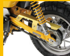
チェーンカバー アルミ製 カラーは4色の予定 HA6551G ¥4,500(予備)