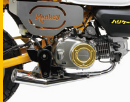
サイドカバー/エンジンカバー & ショートタイプ ダウンマフラー <試作品>