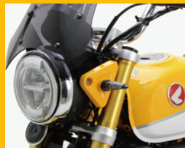
LEDダガーウインカーkit アルミ製 専用ジョイントハーネス付 車検にも対応の最小照射面積 <製品化予定>