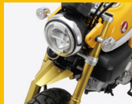
フロントフェンダー アルミ製ショートタイプ 2ピース カラーは4色の予定 HA6515G 価格未定