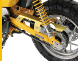
チェーンカバー アルミ製 カラーは4色の予定 HA6551G ¥4,500(予備)