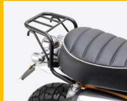
リアキャリア スチール製 φ19.1mm 許容積載量3.5kg 荷台サイズ 前幅250×後幅210×長さ150mm HA6323B ¥13,500(予備)