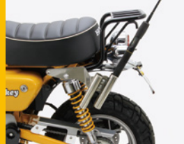
ロッドホルダー ステンレスホルダー全長150mm 内径30mm 専用ステンレス取付ステー付 HU1007S ¥8,000(予備)