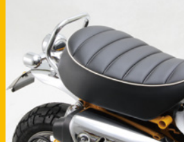
アシストグリップ スチール製 φ19.1mm クロームメッキ HA6324C ¥7,000(予備)