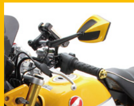
タロンミラー 全8色からカラーを選べます 角度調整可能 アルミダイキャスト製 HA6251Y 1ヶ ¥6,200