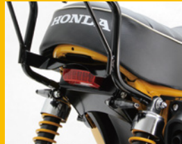
テールランプkit LEDレクタングル クリアレンズも有り ※右記マッドガードとウインカーの交換が必要 HA5820R ¥8,600(予備)