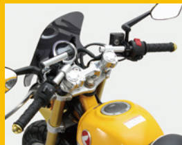
インスパイアセパレートハンドルkit 高精度マシニング加工だからこそその 多様で広範囲な調整が可能 HS6001 ¥45,000