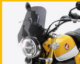
スクリーン アクリル製3mm厚 ブラックスモーク 専用アルミステー付 HA6101 ¥17,000(予備)