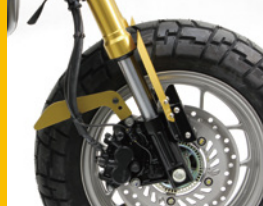
フォークガード アルミ製2ピース カラーは4色の予定 HA6554G ¥5,000(予備) ホースサポート <試作品>