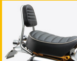
バックレスト スチール製 φ25.4mm パット付 HA6408C ¥15,500(予備)