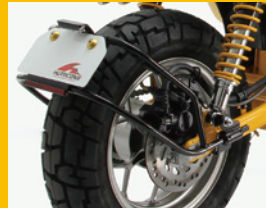
マッドガード スチール製 φ12.7mm / LEDライセンスランプ 専用延長ハーネス付 HA7465B ¥21,000(予備)